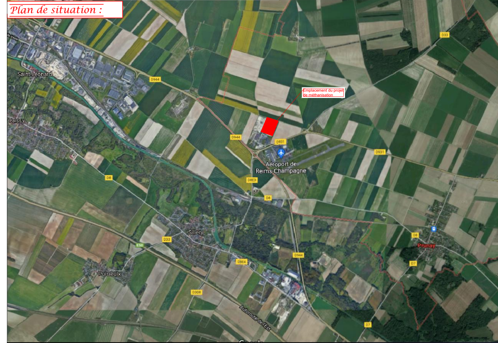
Plan de situation :